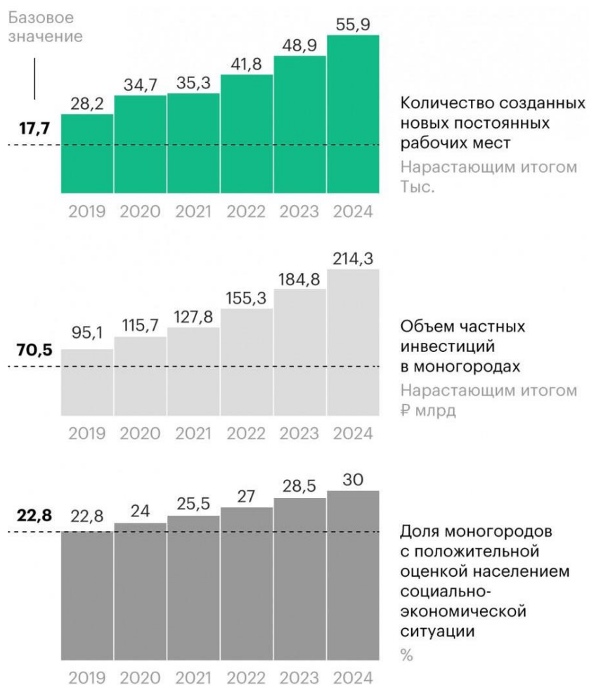
Рис. 1 – Целевые показатели развития моногородов [7]

Каждый город отличился по-своему, согласно результатам 2022 г., моногород Котовск, расположенный в Тамбовской области, занял первое место в рейтинге оценки и анализа экономической ситуации населением моногорода. Наибольшее количество резидентов в ТОР было привлечено городом Тольятти, на сегодняшний день на территории города функционирует уже порядка 69 резидентов. Занятое на вакансиях МСП трудовое население Новоульяновска широко оценено рейтингом, в том числе горожане одобряют политику муниципальной поддержки в моногороде и удовлетворены её мерами. За 2022 год в городе Череповце значительно увеличилось число субъектов МСК, город зарекомендовал себя в информационном поле, вступив в пилотный проект, созданным Правительством Москвы по ЦУР. Развитие МСП является одной из ключевых задач моногорода Магнитогорска, в свою очередь Нижнекамск осуществляет глубокое структурное взаимодействие с институтами развития