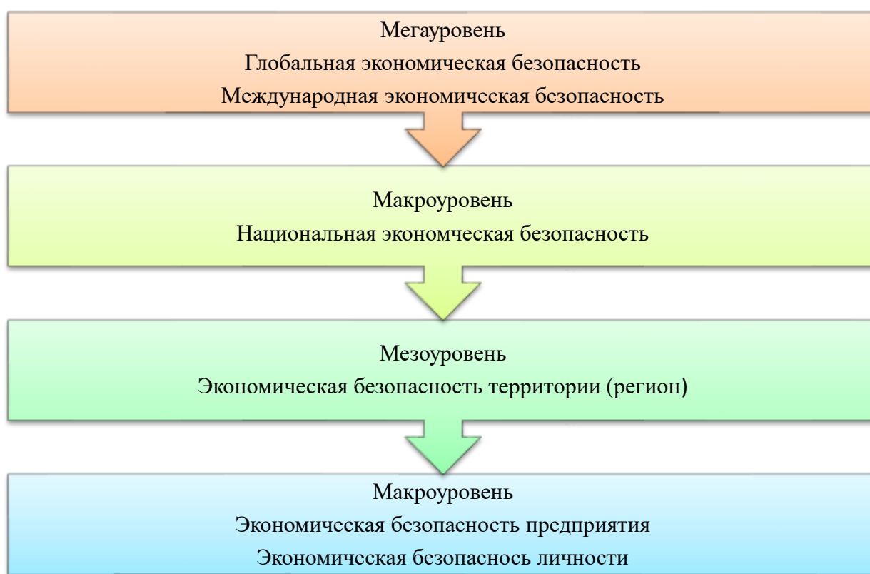
Рис. 3 – Степень масштабности экономической безопасности

- поддержание престижа государства, суверенитета в принятии окончательных решений, затрагивающих вопросы политической и экономико-социологической стороны управления деятельностью государства, а также обеспечение качества уровня жизни не хуже других цивилизованных стран.