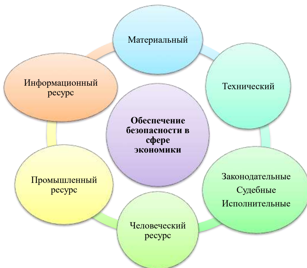
Рис. 2 – Основные компоненты, влияющие на экономическую систему

Системой управления в сфере экономики называют структуру взаимосвязанных элементов, движимых одной целью посредством принятия руководящих решений. Но экономическая система это лишь перечень