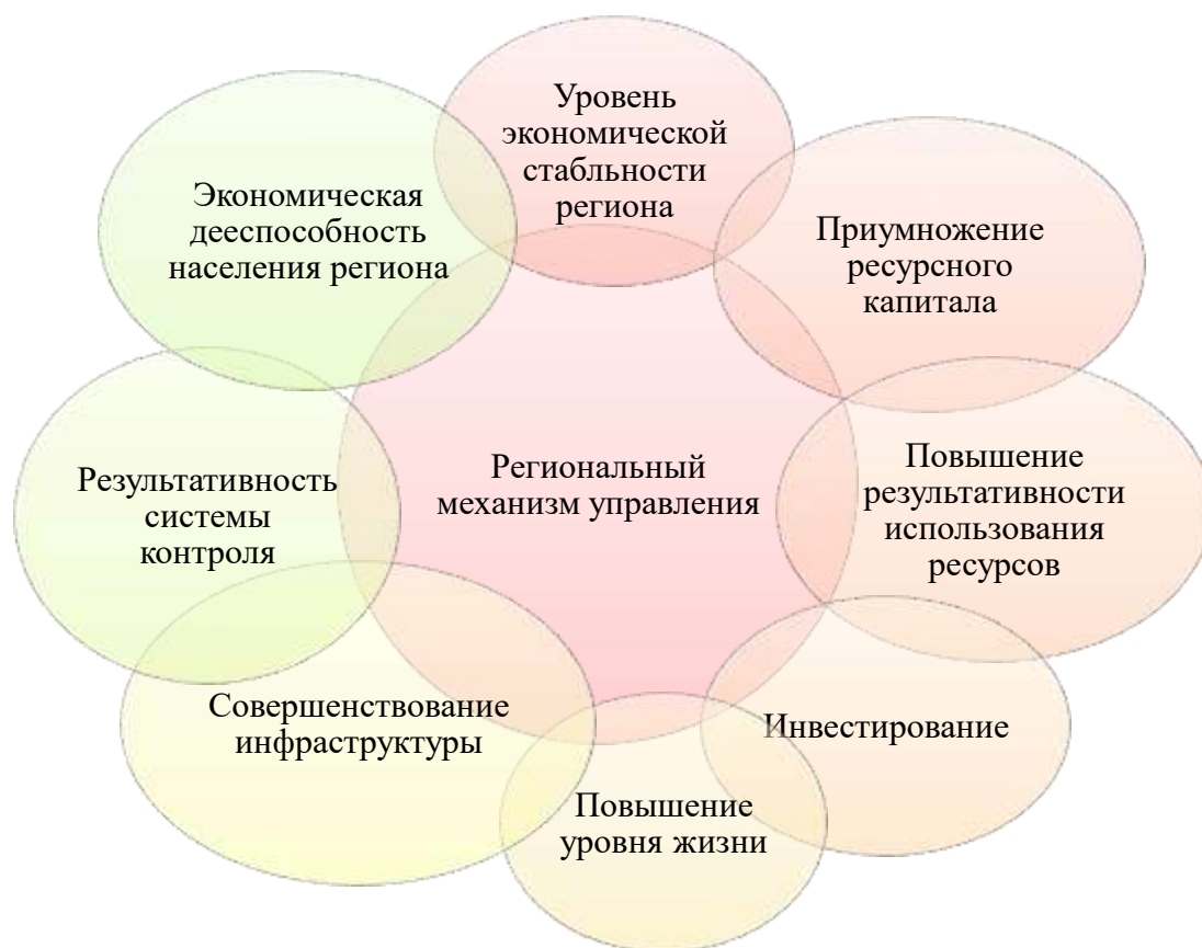
Рис. 5 – Региональный механизм управления

Практически все задачи по организации государственной экономической безопасности нужно начинать именно с регионального уровня, так как эффект управленческих решений будет результативнее, в отличие от федерального (рис. 5). Первостепенное значение для областного управления имеет гарантирование комфортного качества жизни граждан путем обеспечения наличия рабочих мест и материальных ресурсов благодаря взаимовыгодному сотрудничеству округов [6].