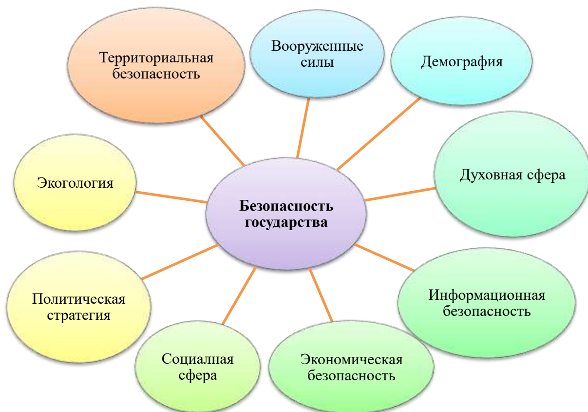
Рис. 4 – Аспекты безопасности государства

Государство должно быть способно к самостоятельному решению на глобальном уровне своих проблем по вопросам отстаивания первостепенных потребностей, сохранению целостности земель, обеспечению свобод своих гражданам в условиях возникновения агрессивных намерений со стороны критических ситуаций внутри страны.