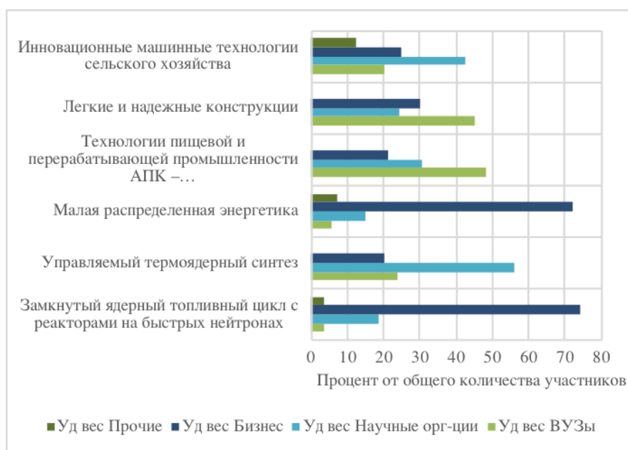
Рис. 3 – Структура участников российских ТП