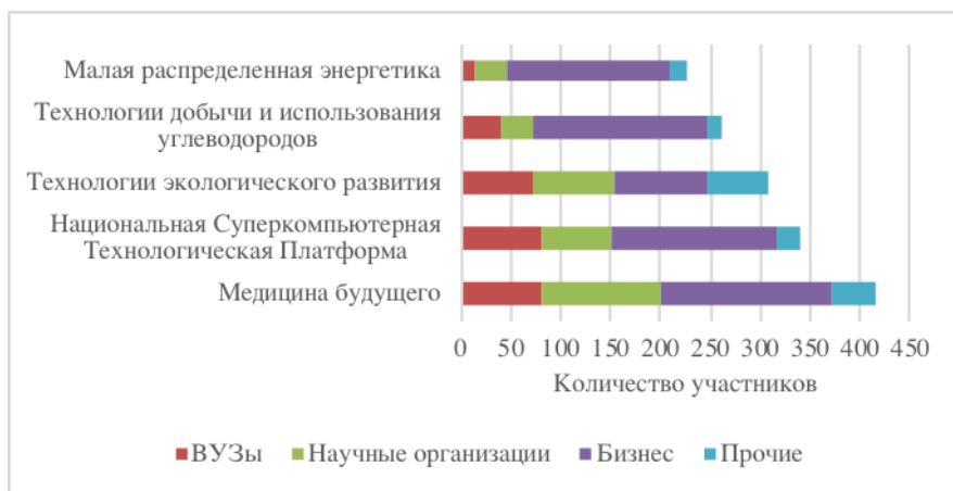
Рис. 4 – Количественный состав участников РТП