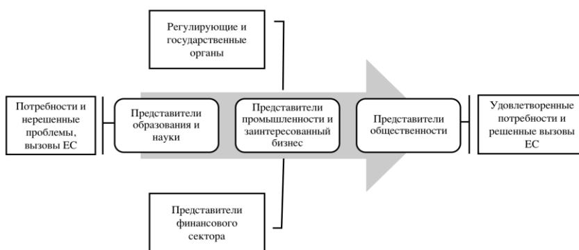
Рис. 1 – Функционирование европейских ТП, как бизнес-процесса

Функционирование ЕТП можно представить в виде бизнес-процесса (рис. 1).