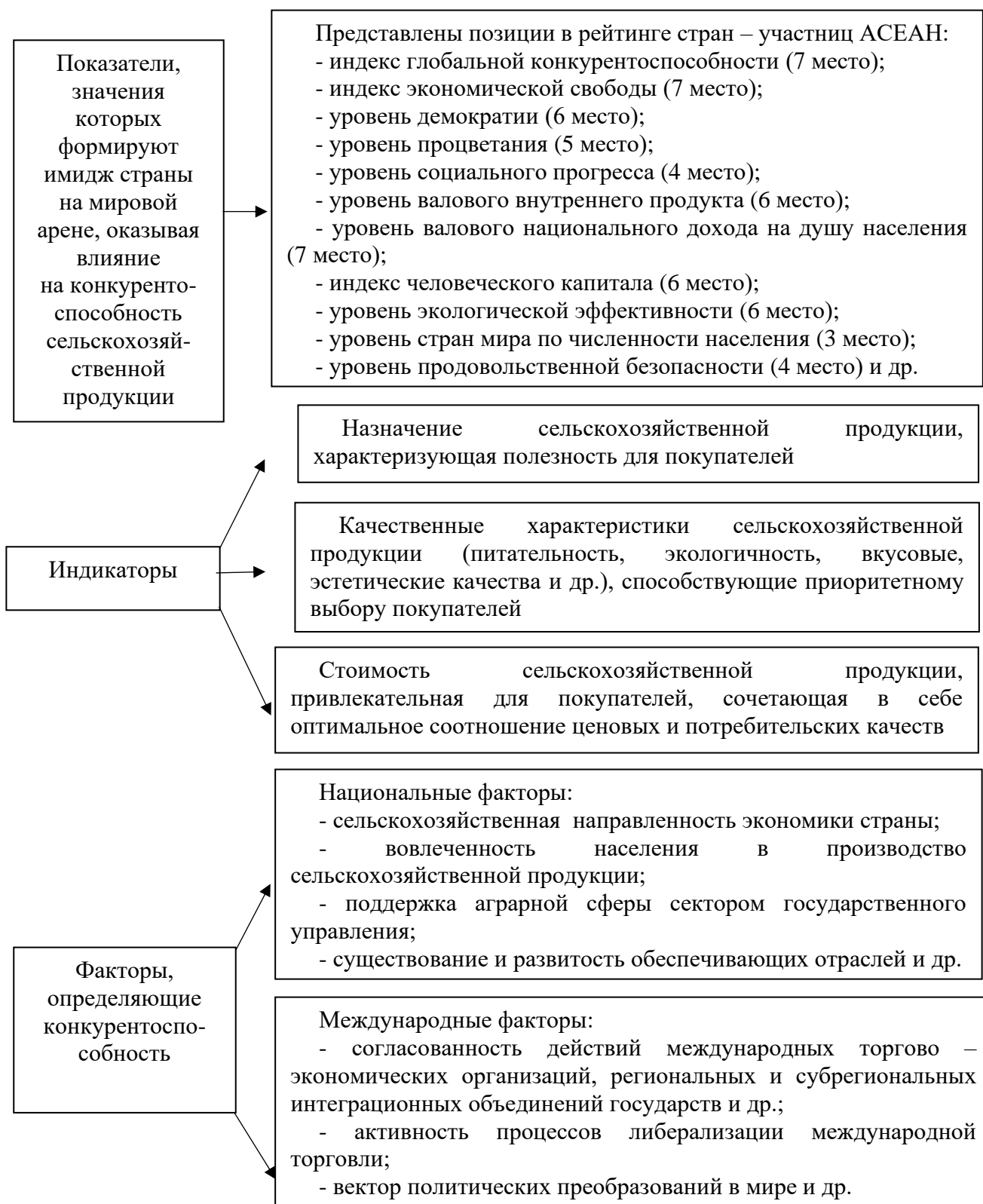
Рис. 2 – Структурное представление составляющих конкурентоспособности сельскохозяйственной продукции Вьетнама на мировом рынке (составлено автором по результатам исследования)

государственного управления, поддерживаются комплексом реализуемых мер, достижения можно отследить по значениям ключевых показателей как в динамике, так при сопоставлении с плановыми значениями [13,14].