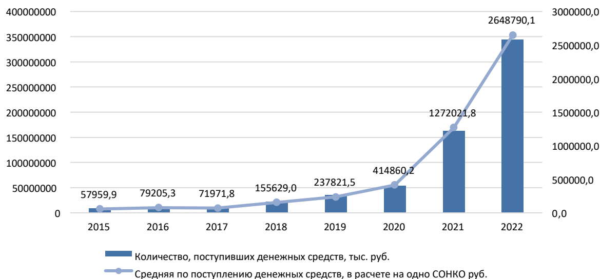
Рис. 1 – Анализ динамики финансовой поддержки НКО государством в России