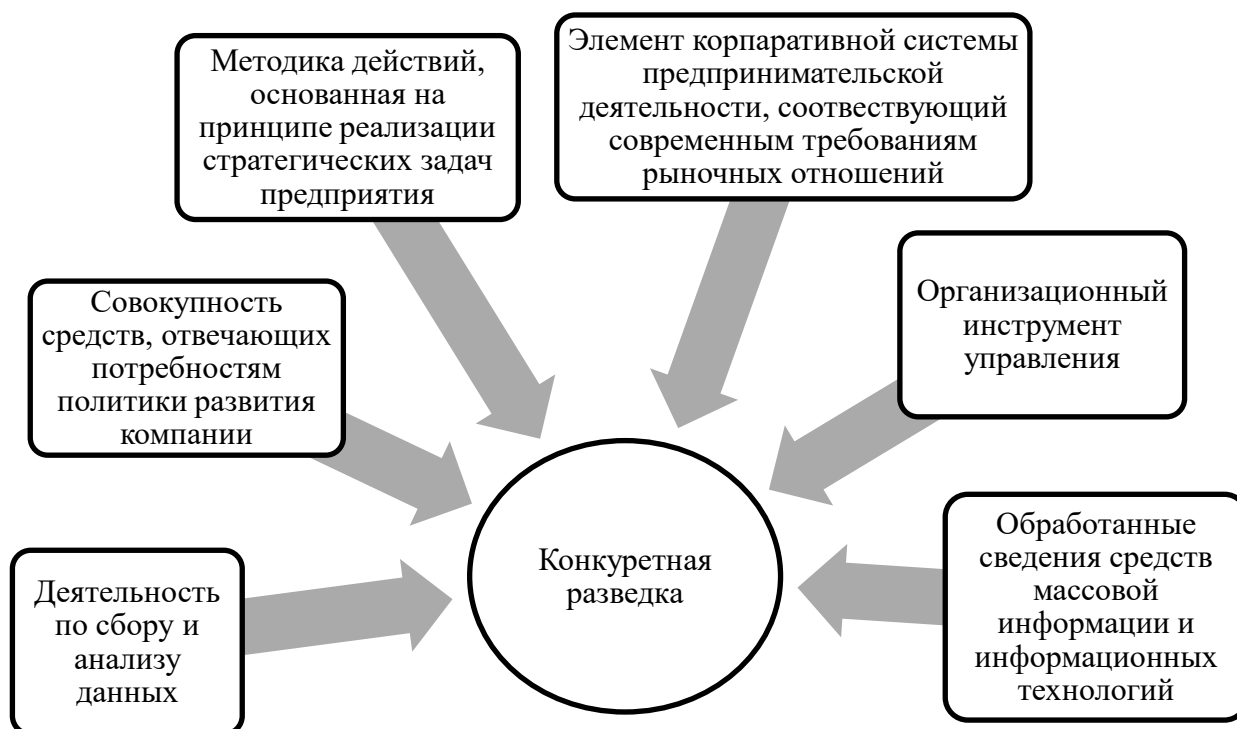
Рис. 1 – Определение понятия конкурентной разведки

специалистов о дальнейшем развитии ситуации на рынке, определить сильные и слабые стороны работы конкретного предприятия в сравнении с конкурентом[1].