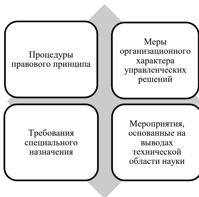
Рис. 4 – Обеспечение защиты сведений, представляющих корпоративную ценность

Оптимальным способом сохранения коммерческой информации об инновационных решениях и аспектах хозяйственного функционирования субъектов экономики является применение комплексных мероприятий, основанных на принципах права, управленческих мер, требований специального назначения, выводах технической области науки. Совокупность средств, контролирующая защищенность сведений, представляющих корпоративную ценность, приведена на рис. 4.