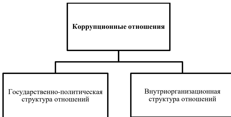
Рис. 6 – Уровни коррупционных отношений

- форсирование событий по разрешению проблем в вопросах, требующих грамотного и взвешенного подхода.