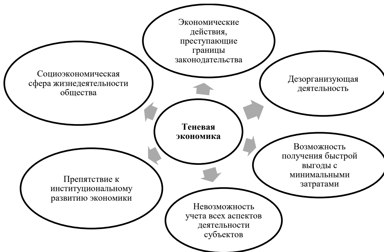
Рис. 3 – Стороны проявления понятия теневой экономики

Несхожесть рассуждений порождается за счет рассмотрения данной проблематики с помощью подходов, построенных на специфике сферы компетенции исследователя и решаемых им задач.