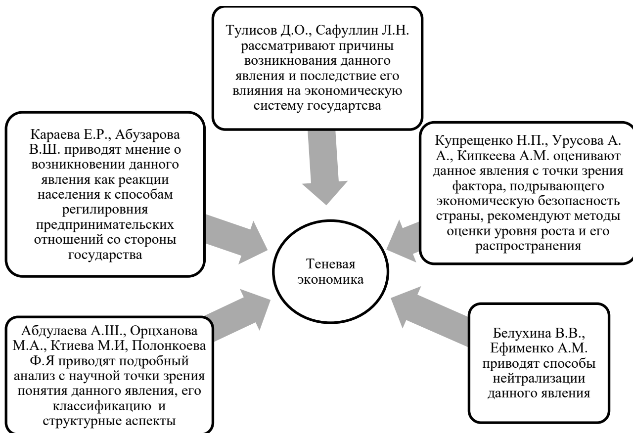
Рис. 1 – Результаты рассмотрения авторских работ на предмет объяснения понятия теневой экономики

Исходя из мнения исследователей, можно сделать вывод о том, что данная проблема появилась давно и заслуживает особого контроля со стороны органов управления, регулирующих партнерские отношения между организациями в сфере рынка[2]. Результаты рассмотрения авторских работ, посвященных подробному разбору понятия теневой экономике как неформальной деятельности, представлены на рис. 1.