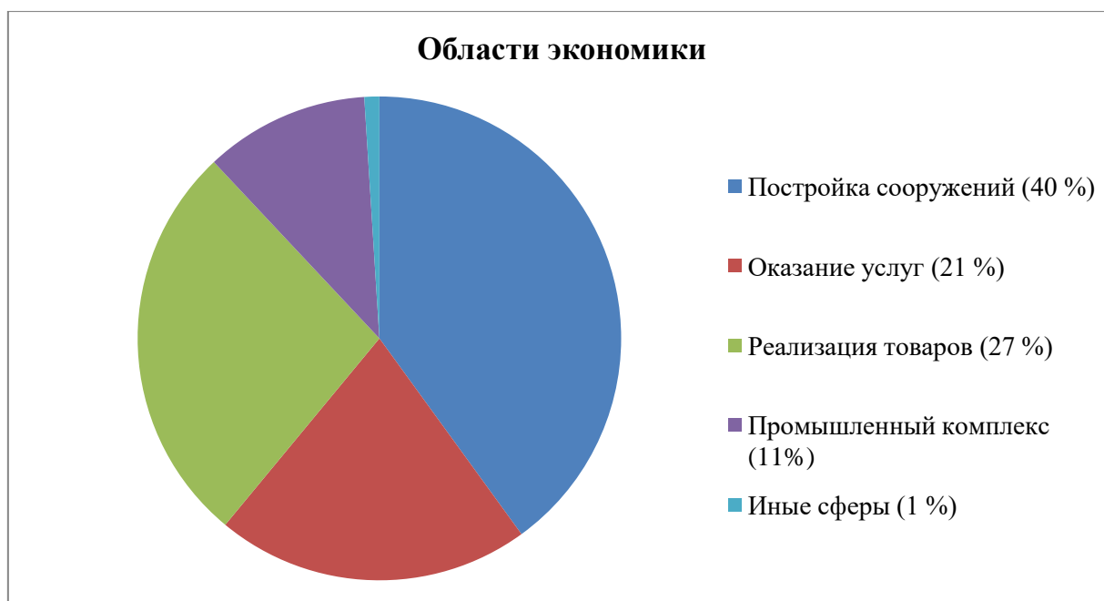
Рис. 4 – Статистика основных областей экономики с повышенным интересом в применении инструментов теневой экономики

- рост производства и оборота на рынке продукции низкого качества, представляющей угрозу жизни для потребителей.